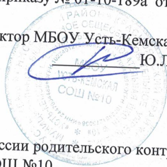
График посещения школьной столовой членами комиссии родительского контроля МБОУ Усть-Кемская СОШ №10 в 2024-2025 учебном году